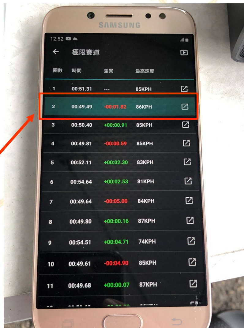
手機: Samsung J7 Pro APP: LL2Link Timer